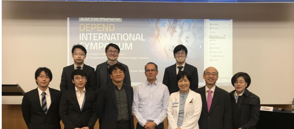
2018 AjoU DEPEND International Symposium 개최 10/30(화)