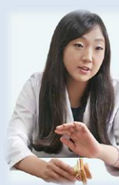
5세부 추옥성 (이비인후과)