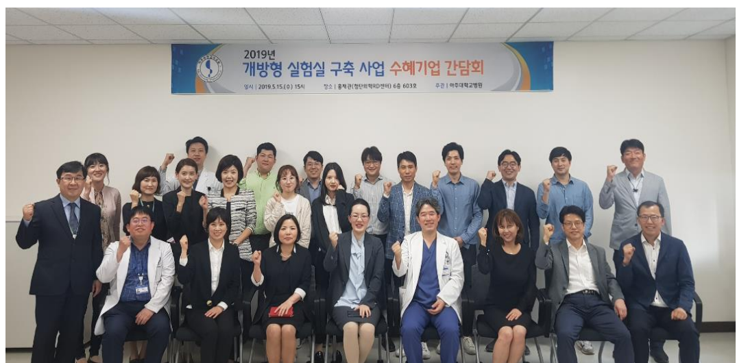
개방형 실험실 구축 사업 수혜기업 간담회 개최 (5/15)