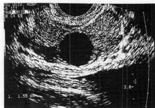
Fig. 4. Transverse image demonstrating cystic structure in the midline of the prostate.