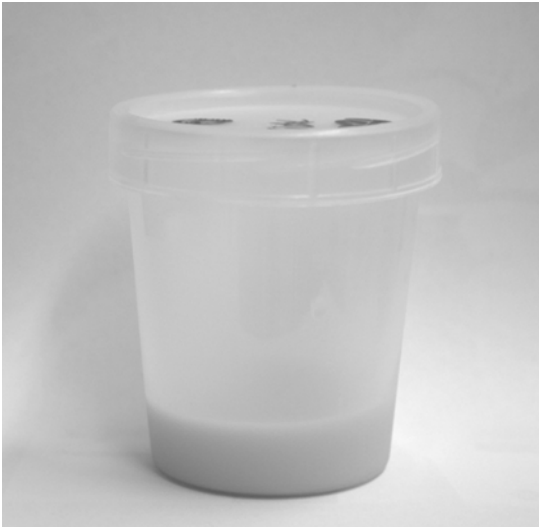
Figure 1. Gross appearance of the creamy-colored urine.

사회력 : 대구에서 출생하여 20대 전후로 약 6년간 부산에 거주하였고, 20년 전부터 수원에서 거주하고 있다. 흡연 및 음주력은 없었다.