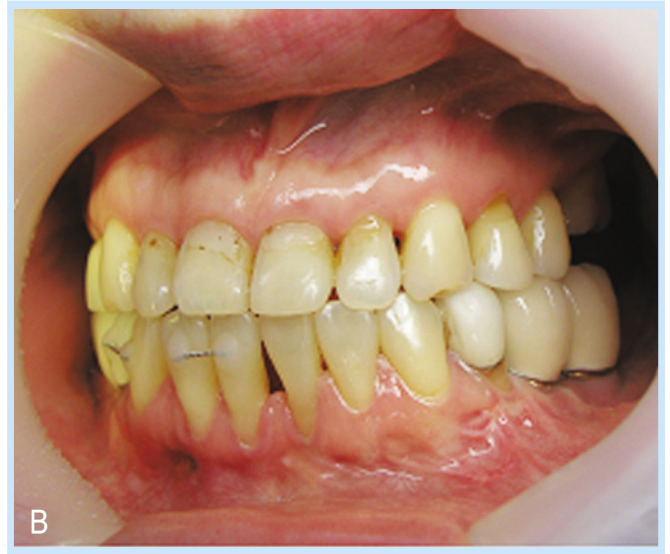
Fig. 6. Final prosthesis (A, B)

Hye-Rin Joeng et al: Rehabilitation of Occlusion Using Orthognathic Surgery and Implant Placement in Partially Edentulous Patient with Mandibular Prognathism; Case Report. Implantology 2008