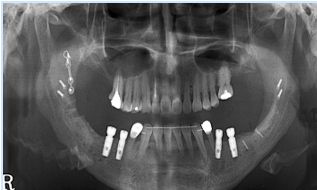
Fig. 5. titanium mesh was removed and implant fixture installation was performed.

Hye-Rin Joeng et al: Rehabilitation of Occlusion Using Orthognathic Surgery and Implant Placement in Partially Edentulous Patient with Mandibular Prognathism; Case Report. Implantology 2008