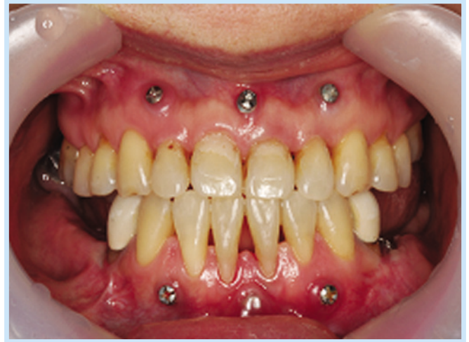
Fig. 4. Debonding was performed.

Hye-Rin Joeng et al: Rehabilitation of Occlusion Using Orthognathic Surgery and Implant Placement in Partially Edentulous Patient with Mandibular Prognathism; Case Report. Implantology 2008