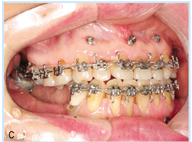
Fig. 2. Postoperative panoramic view and intraoral view Post op-1 day panoramic view (fig. 2A). After post operative 3 months intraoral view (fig. 2B, C) Jaw relationship and alveolar ridge volume were improved

Hye-Rin Joeng et al: Rehabilitation of Occlusion Using Orthognathic Surgery and Implant Placement in Partially Edentulous Patient with Mandibular Prognathism; Case Report. Implantology 2008