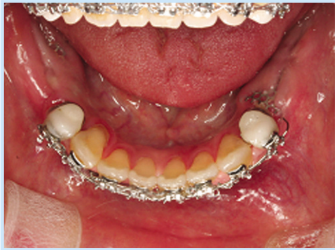
Fig. 3. Post op 3 months intraoral view, Titanium mesh was exposed.

Hye-Rin Joeng et al: Rehabilitation of Occlusion Using Orthognathic Surgery and Implant Placement in Partially Edentulous Patient with Mandibular Prognathism; Case Report. Implantology 2008