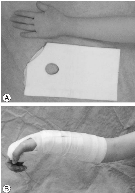
Fig. 2. Radial gutter splint. (A) Space cut out for thumb. (B) Molding and elastic bandage for stabilization. (C) Shape of splint.

설탕 부목 집게 부목과 요측 구형성 단상지 부목을 사용한 환자간에 정복 소실 정도를 요측 높이, 요측 경사, 수장 경사로 나누어 분석한 결과 통계적으로 유의한 차이는 보이지 않았다(Table 2B, p-value>0.05).